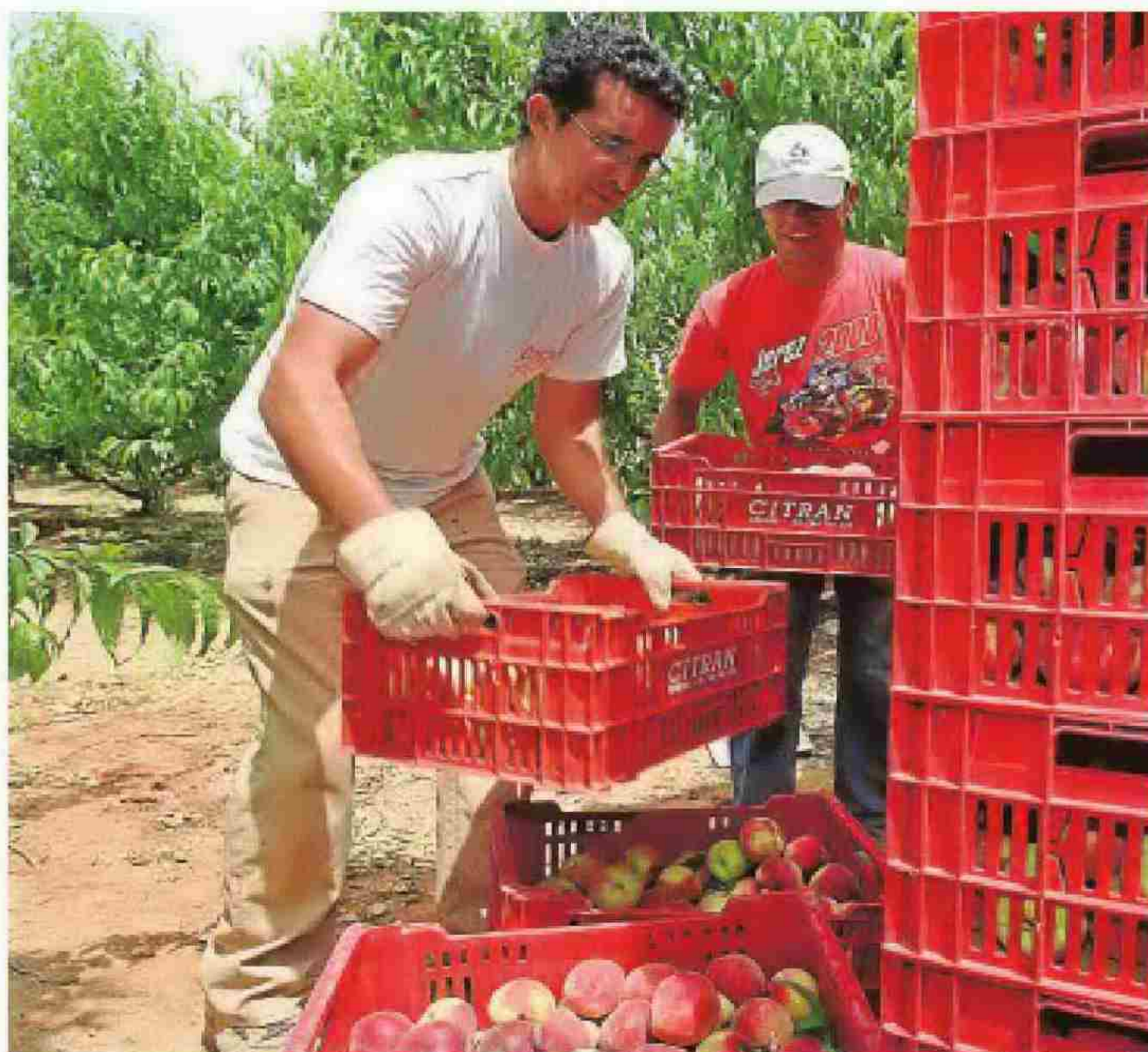
Las ayudas para los jóvenes agricultores ya se han convocado