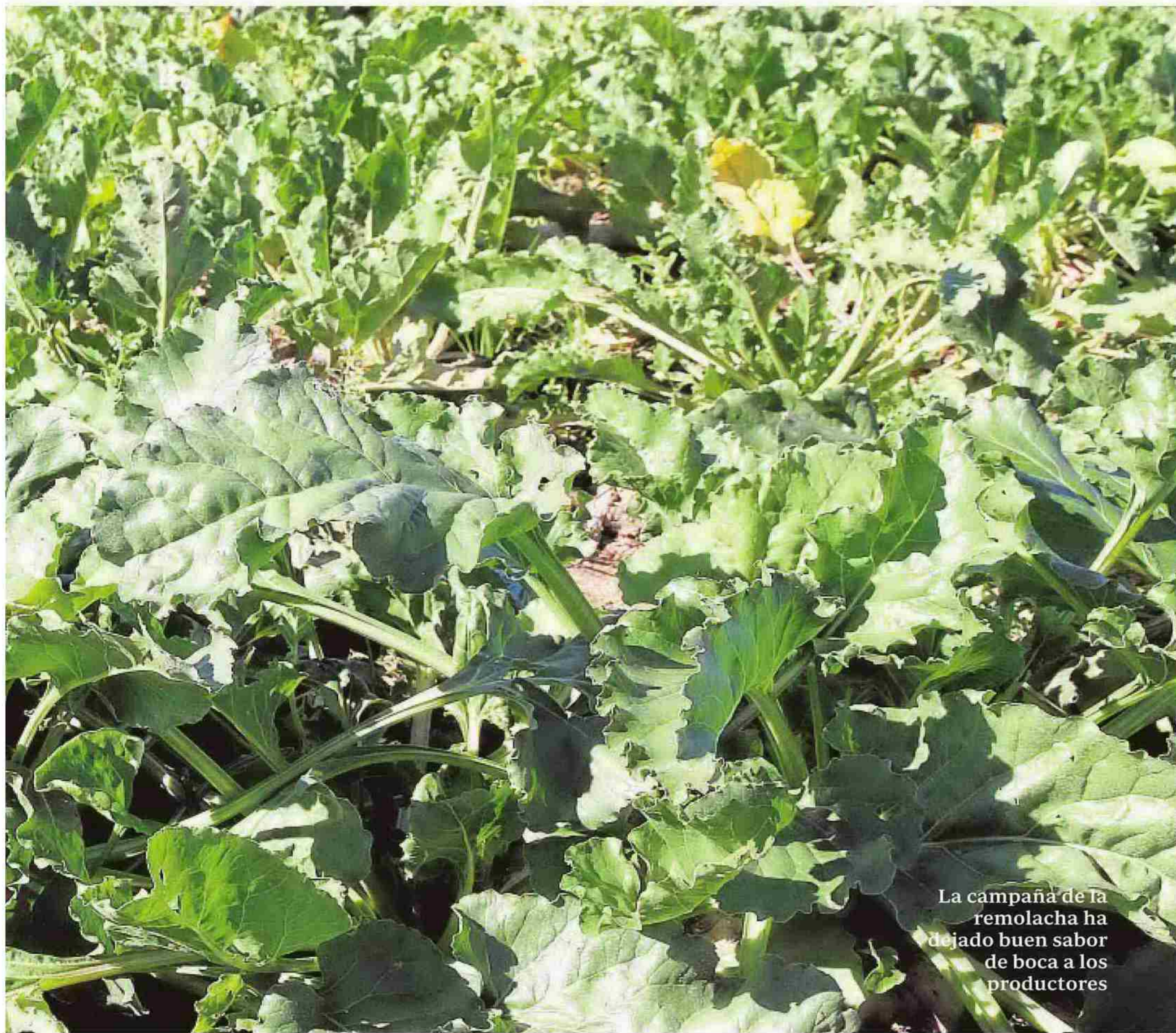
La campaña de la remolacha ha dejado buen sabor de boca a los productores